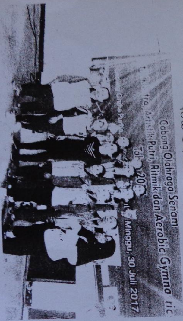
Gambar 5 Atlet Kabupaten Sleman