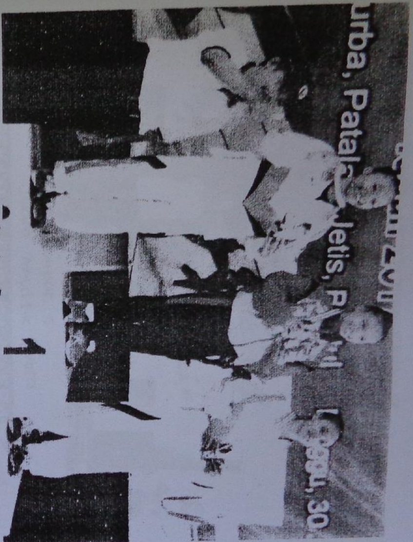
Gambar 1 Juara Artistik Putri