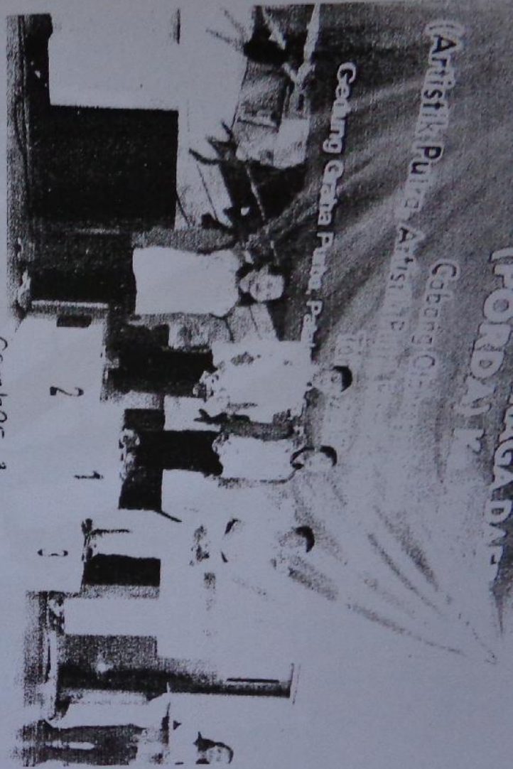
Gambar 3 Juara Artistik Putra